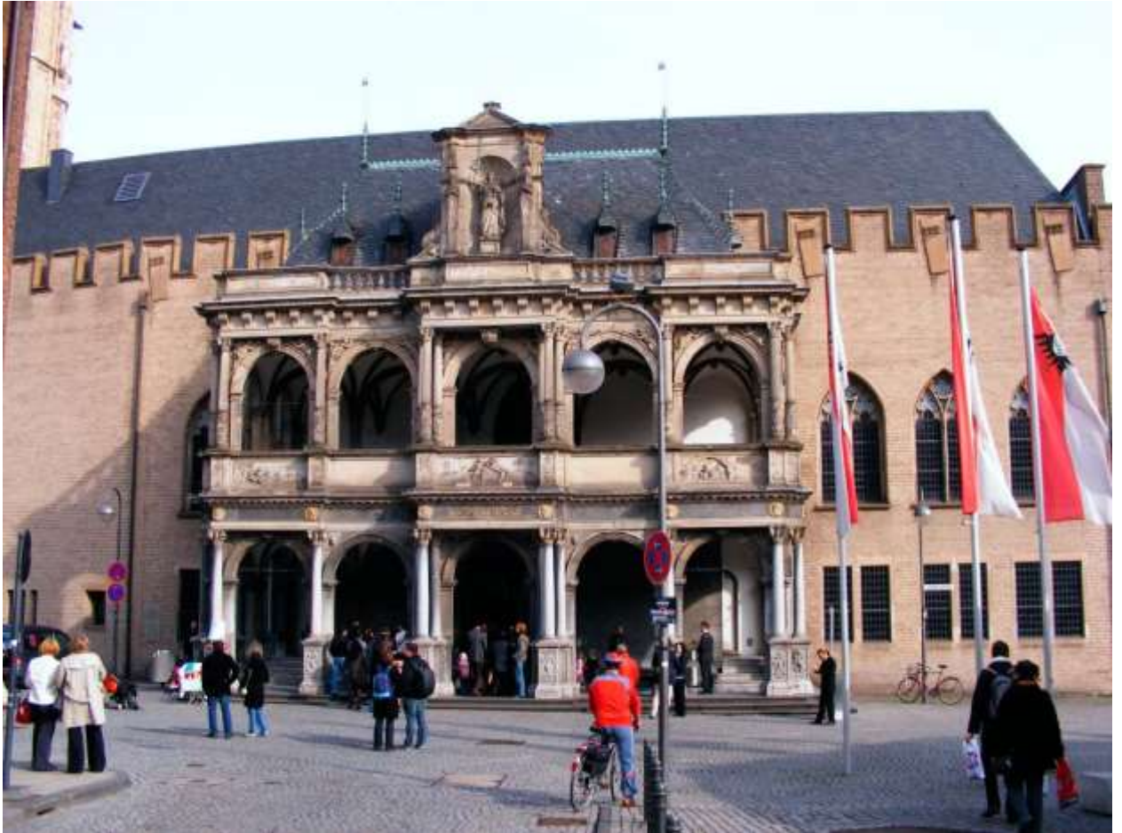
Кёльнская ратуша (Kölner Rathaus)