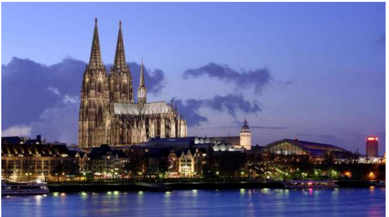
Кёльнский собор (нем. Kölner Dom)