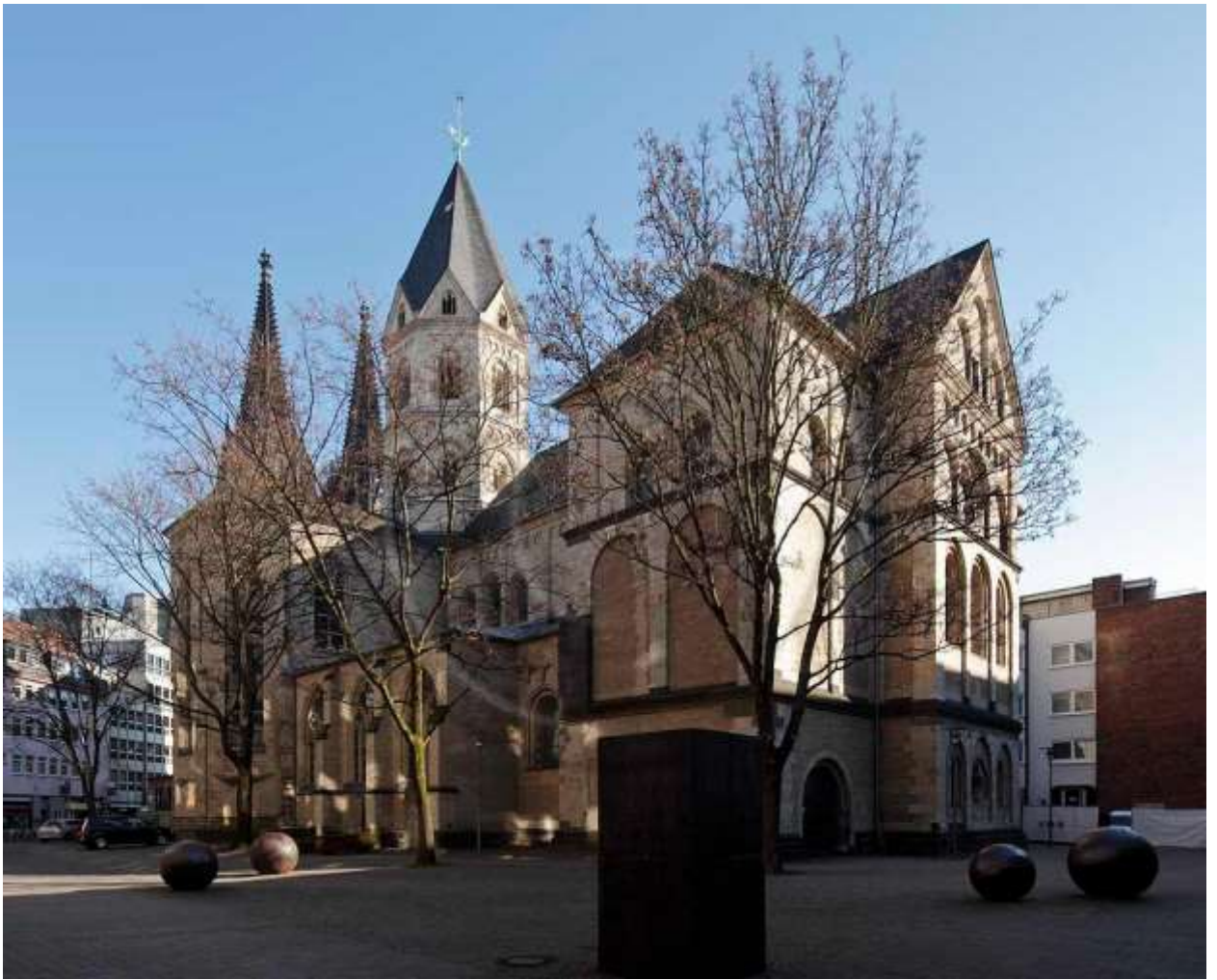
Церковь Святого Андрея (St. Andreas)