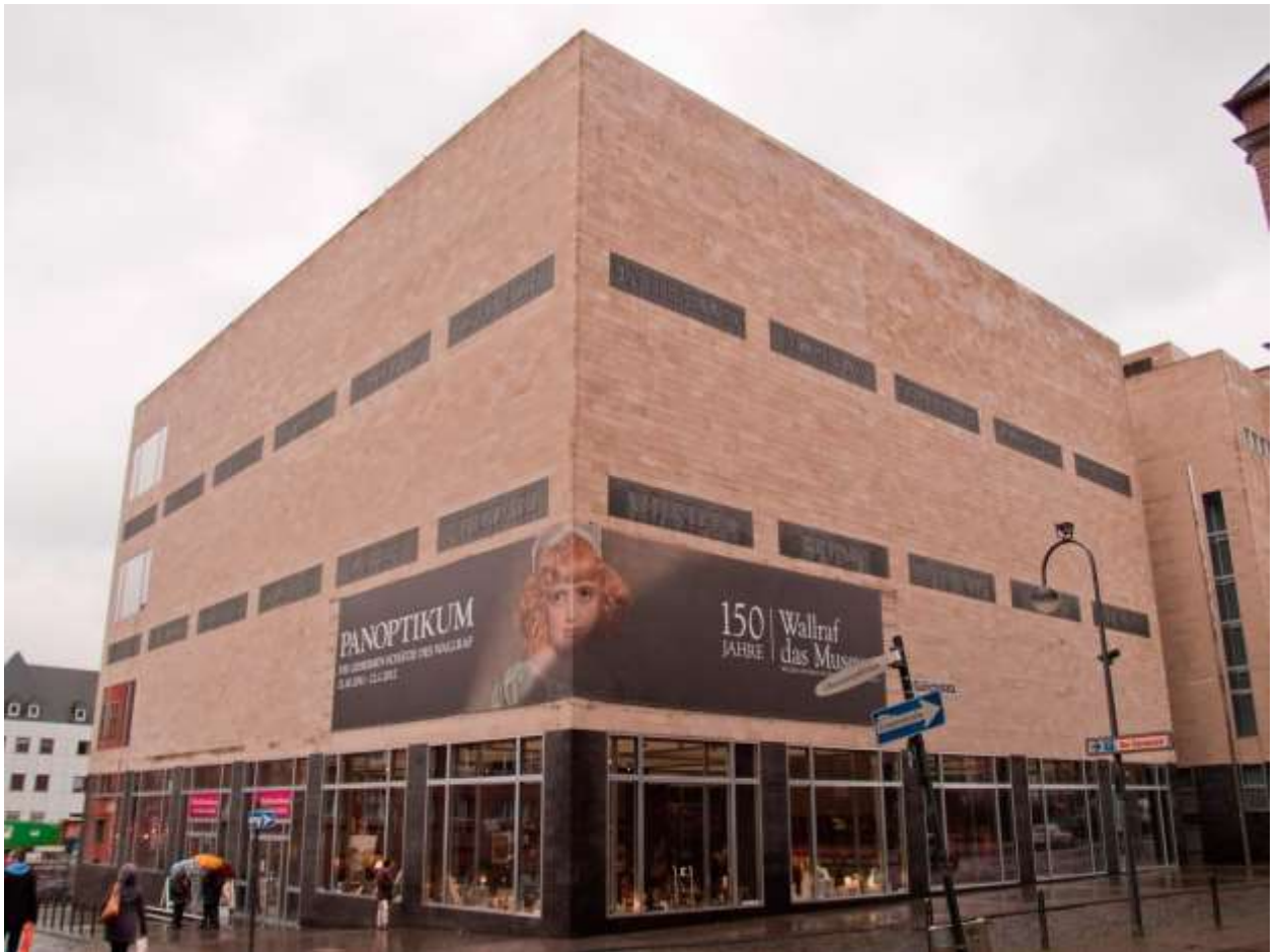
Музей Вальрафа-Рихарца (Wallraf Richartz Museum & Fondation Corboud)