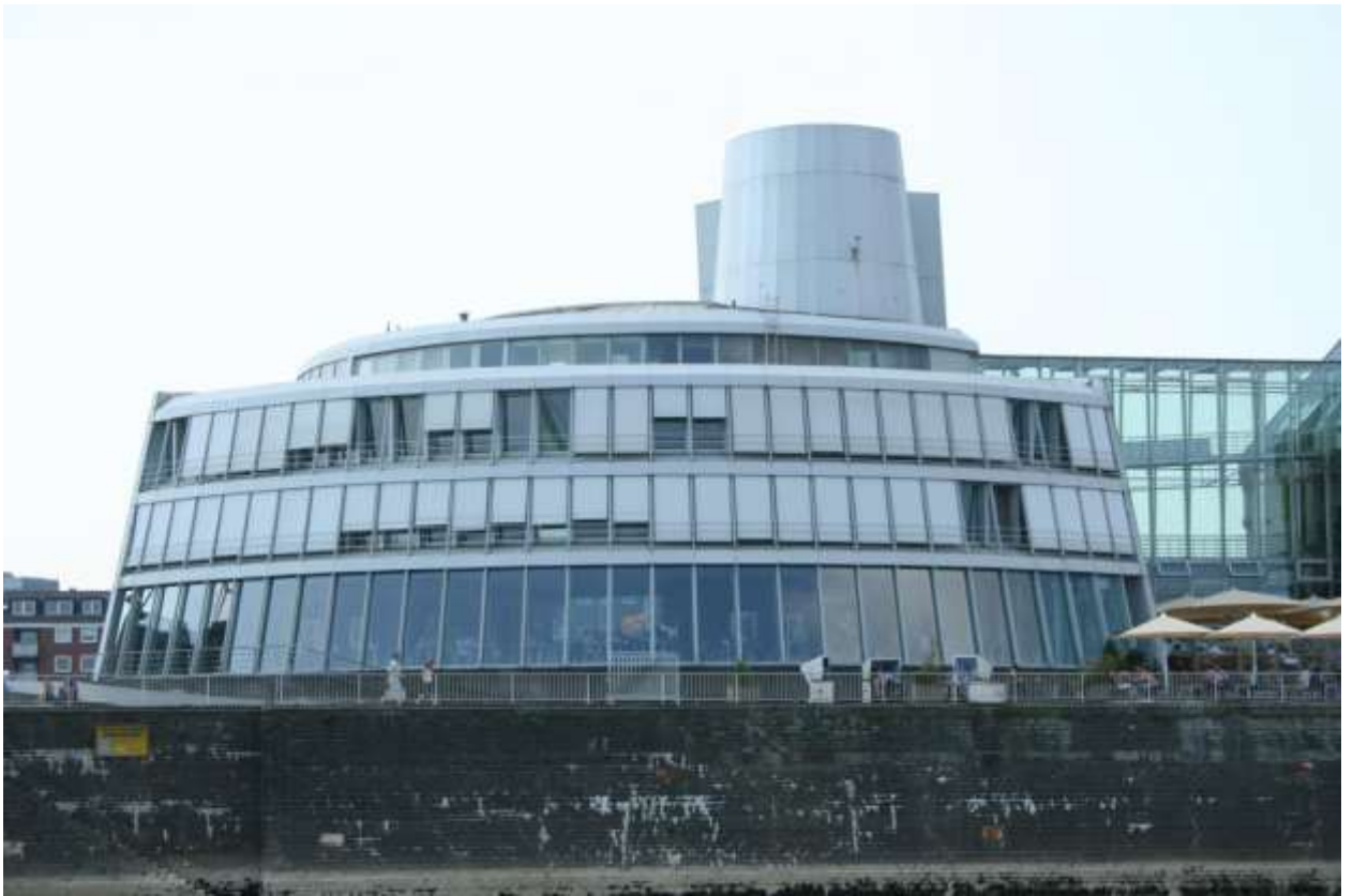
Музей шоколада (Schokoladenmuseum)