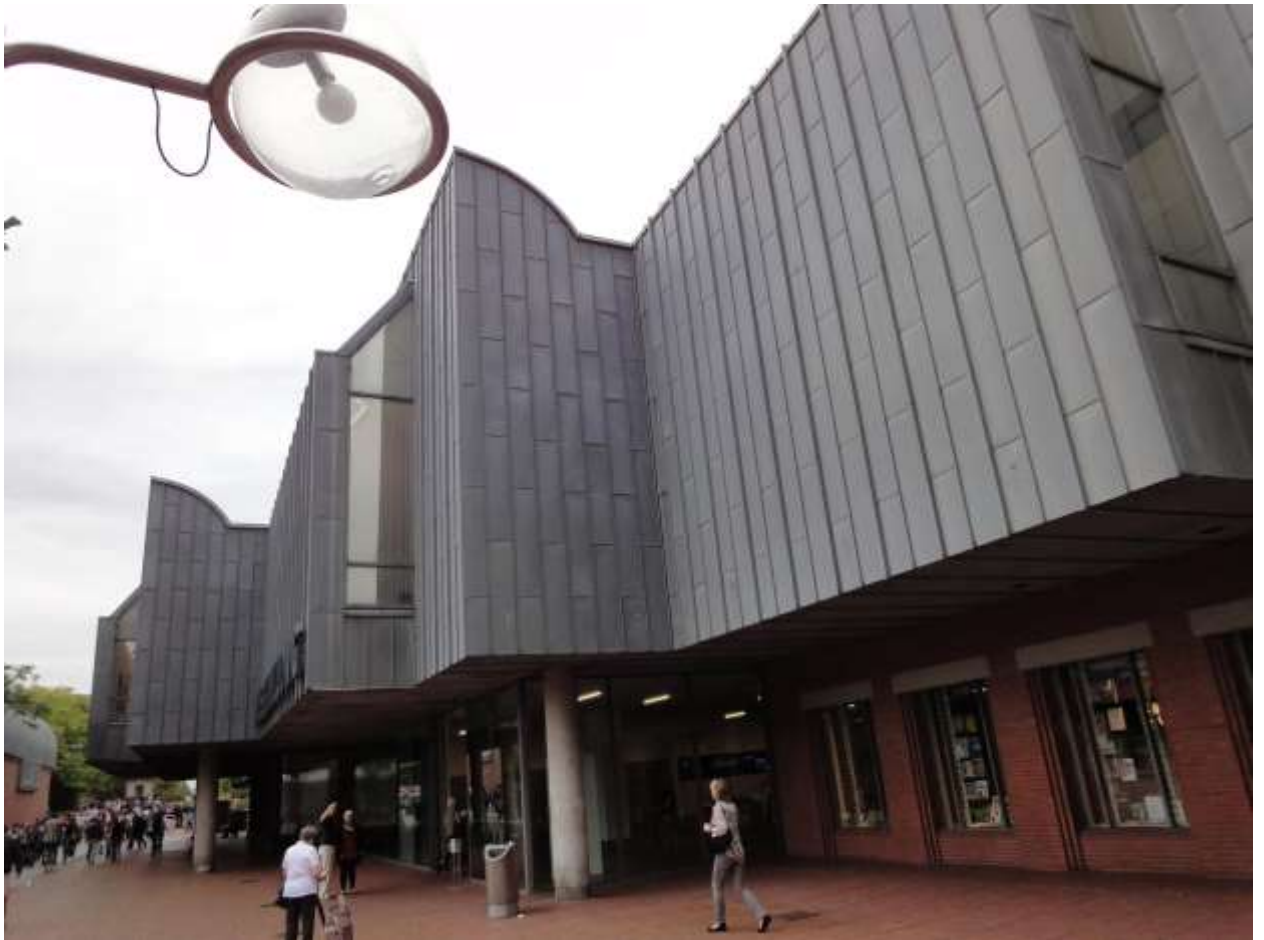
Музей Людвига (Museum Ludwig)