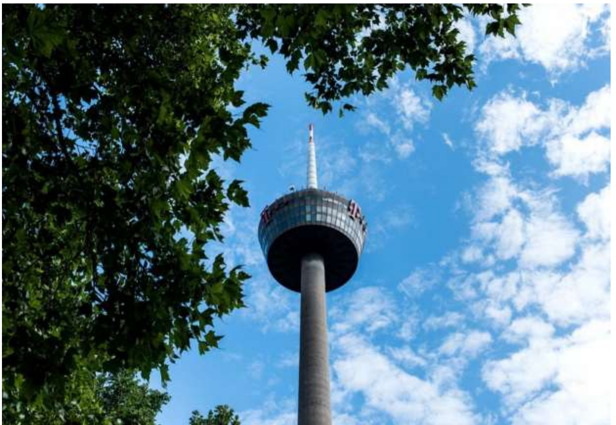
Железобетонная телевизионная и радиовещательная башня (Colonus)

Кёльн фото достопримечательностей города. Кёльн один из городов Германии, который расположен в земле Северный Рейн-Вестфалия. Он является одним из самых крупных культурных и экономических центров страны, а также идет по счету третьим по площади и четвёртым по населению в Германии.