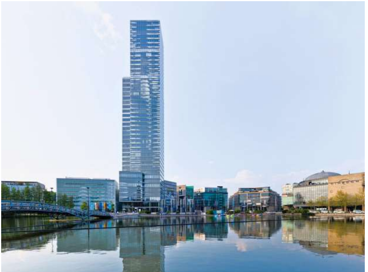
Кёльн Турм (KölnTurm)