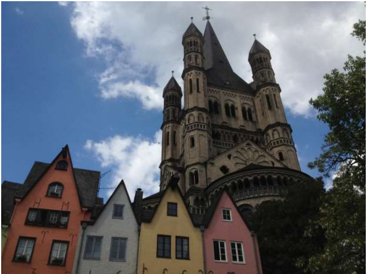
Большой Святой Мартин (Groß St. Martin)