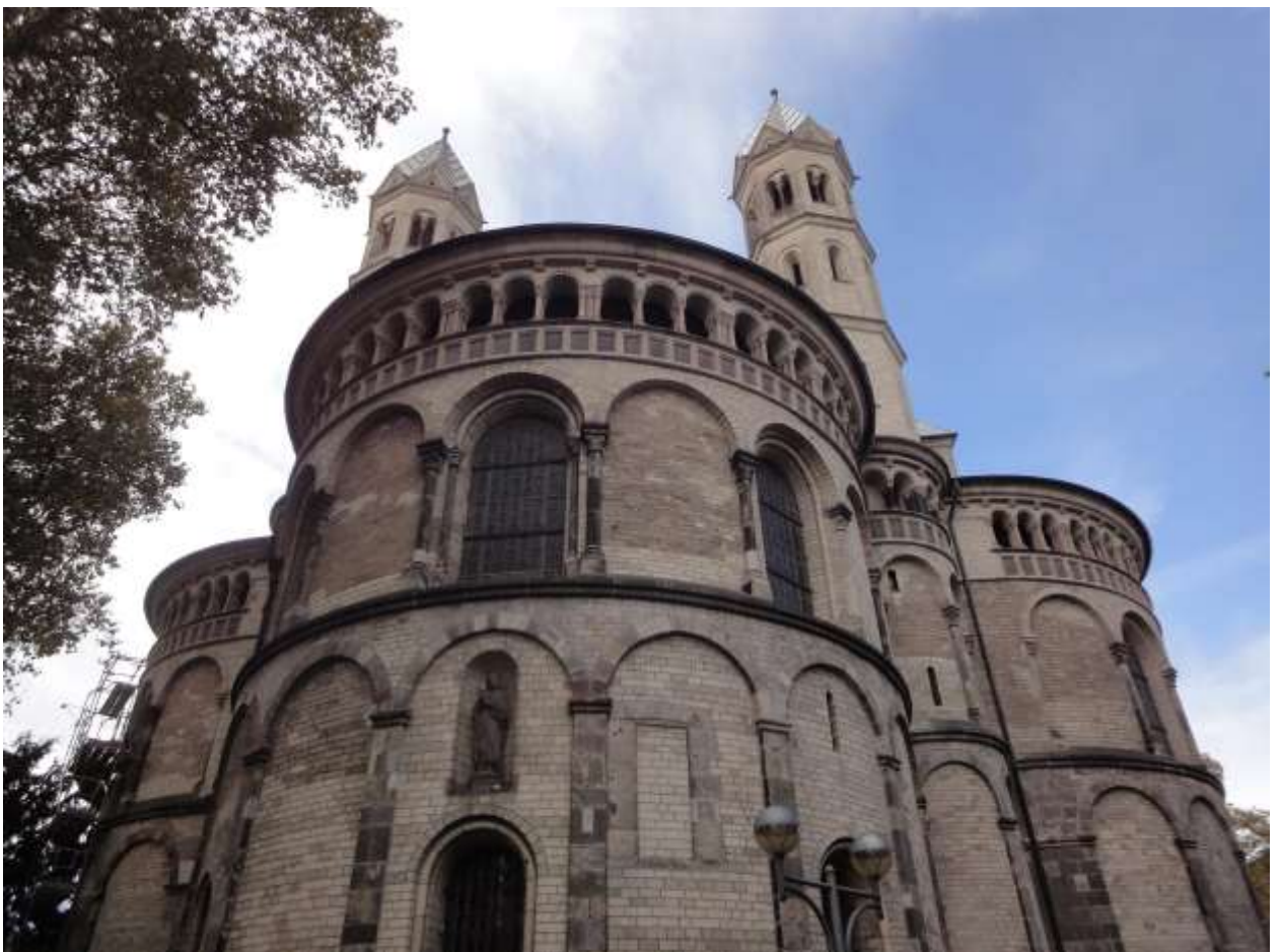
Апостольская церковь (St. Aposteln)