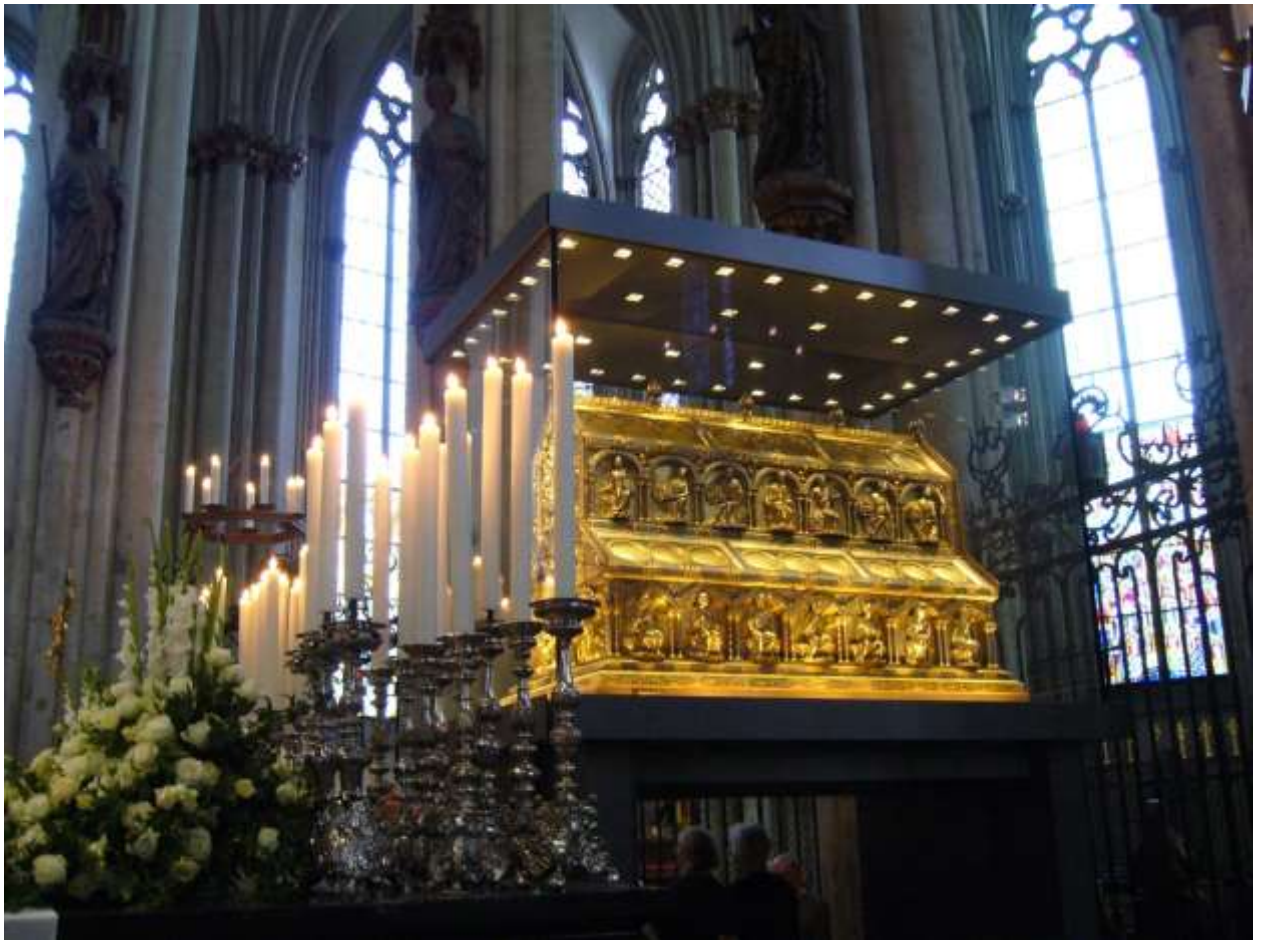
Рака трёх царей-волхвов (Dreikönigsschrein)