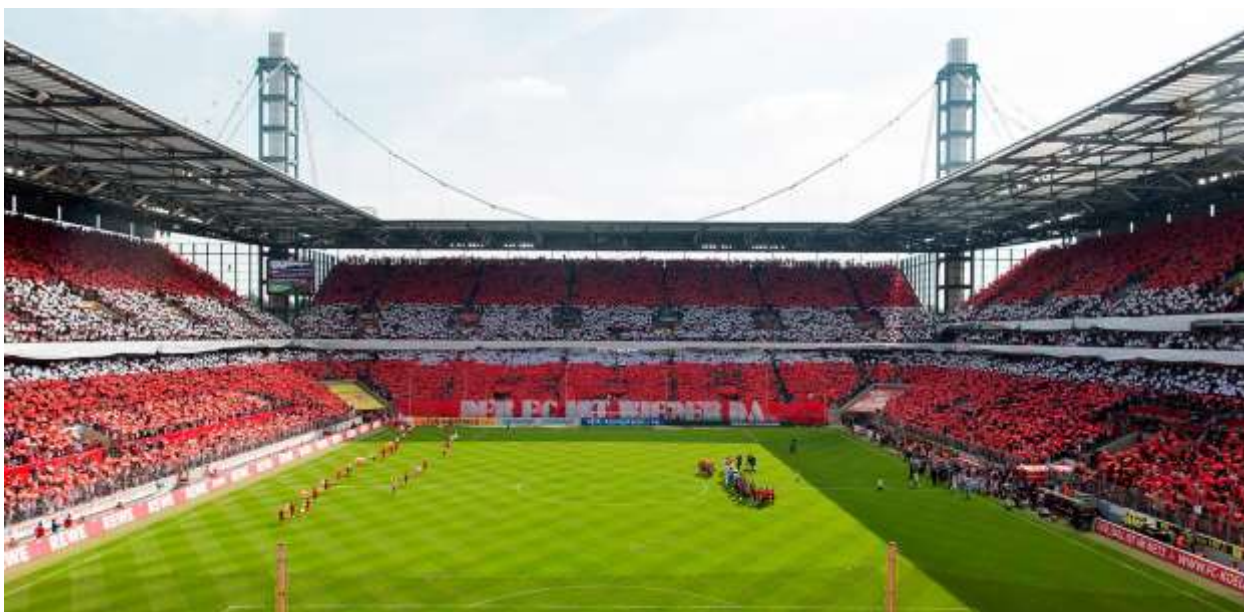
Рейн Энерги Штадион (RheinEnergieStadion)

Кельнский городской центр документации национал-социализма ( NS-Dokumentationszentrum der Stadt Köln )