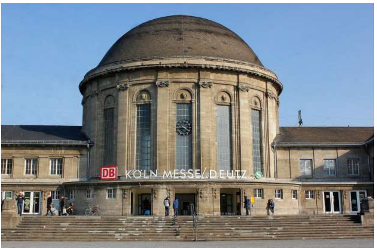
Вокзал Кёльн-Мессе/Дойц (Bahnhof Köln Messe/Deutz)