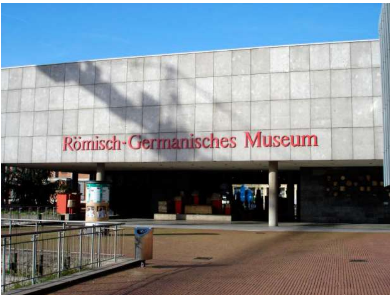
Римско-германский музей (Römisch Germanisches Museum)