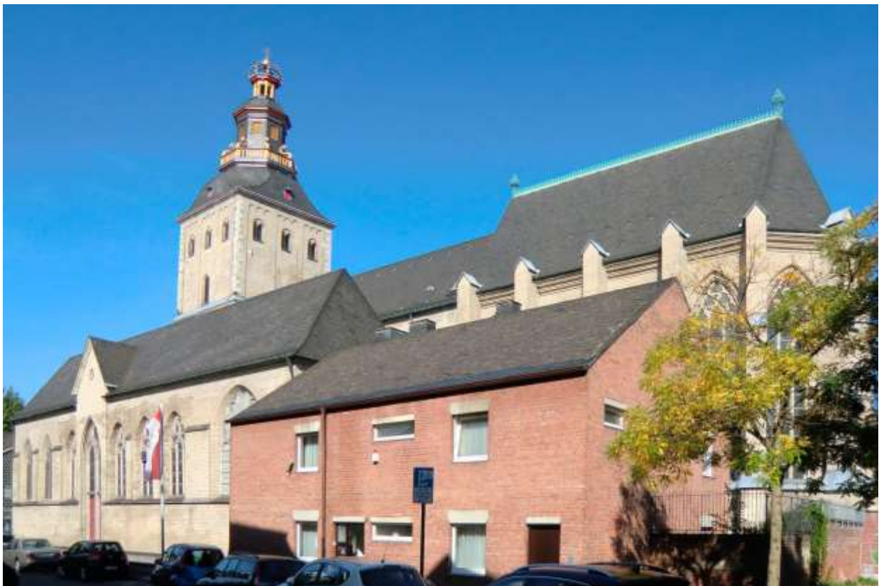
Церковь Святой Урсулы (St. Ursula)