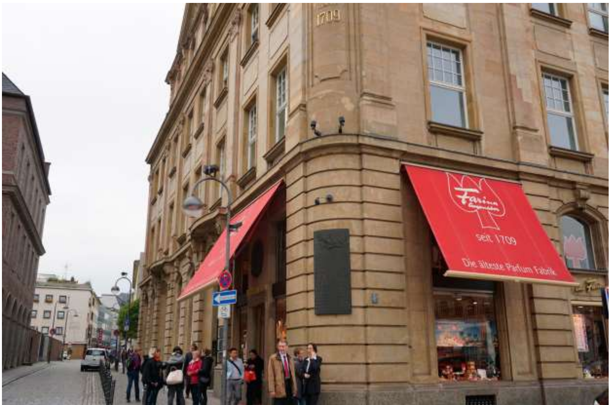
Музей духов (Farina Haus Duftmuseum)