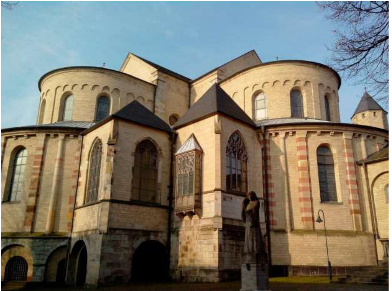
Церковь Святой Марии Капитолийской (St. Maria im Kapitol)